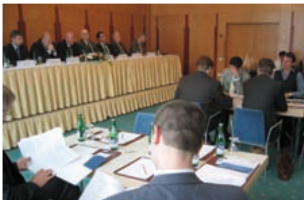
Valná hromada PK ČR, 29. 5. 2006, Movenpick Hotel Prague

a v inovačních aktivitách již začíná hrát i Česká technologická platforma pro potraviny, propojující zainteresované strany podél celého potravinového řetězce, včetně prvovýroby a obchodu, která po prvním roce své činnosti začíná vykazovat první výsledky. Platforma sice vychází z priorit Evropské technologické platformy pro