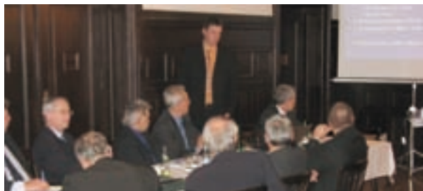
Prezentace projektu Truefood, 30. 11. 2006, Plzeňský Prazdroj, a.s.

1. 5. 2006 klade v období 48 měsíců, let (2006 – 2010) priority: zlepšit kvalitu a bezpečnost potravin, a představit inovaci do výrobního systému tra-