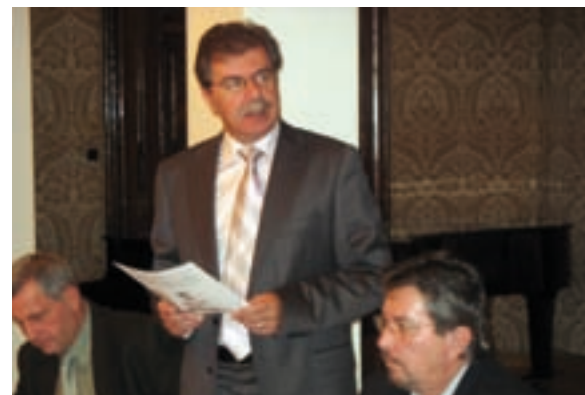
Česká technologická platforma pro potraviny, 13. 12. 2006, Kaiserštejnský palác

Koherentní strategii výzkumu pro budoucnost je nutné vytvořit na základě společné vize různých zainteresovaných stran. Klíčové prvky této flexibilní strategie zahrnují iniciativy v prioritních oblastech potraviny a zdraví, kvalita potravin a výroba, potraviny a spotřebitel, bezpečnost potravin, udržitelná výroba potravin a řízení potravinového řetězce . Tyto prvky musí být podpořeny účinnými strategiemi komunikace, školení a transferu technologií.