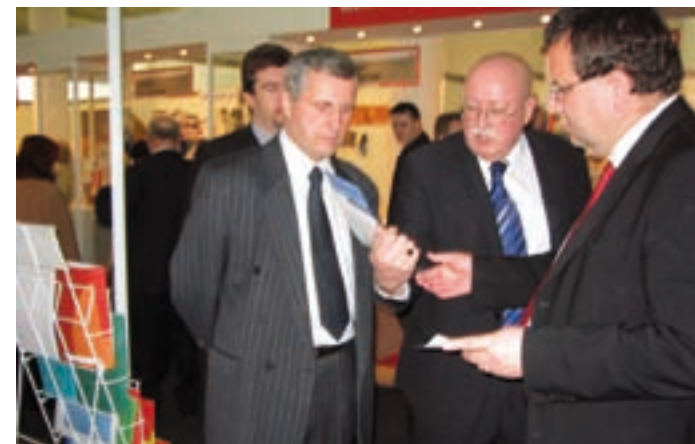
Návštěva stánku PK ČR, 9. 3. 2006, Salima 2006/Brno

Český maloobchodní trh se vyvíjel i v loňském roce ve znamení dalšího posilování postavení obchodních řetězců, kde pokračovala tvrdá cenová válka uvnitř jednotlivých kategorií, mezi super a hypermarkety a diskontem, i mezi řetězci a nezávislým obchodem. Díky této situaci se začíná stírat, ke škodě dodavatelů i zákazníka, cenový i kvalitativní rozdíl zejména u potravin. Tato válka má již své první padlé – Julius Meinl, Carrefour, Edeka. Bohužel ztráty jsou jako obvykle připsány na účet dodavatelů, kteří tuto expanzi i s výše zmiňovanou obchodní válkou plně financují. O nápravu mnoha nečestných a někdy až nestoudných praktik používaných obchodními řetězci se pokouší novely zákona o hospodářské soutěži, zatím předkládané bez