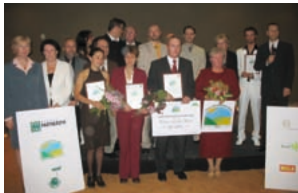
Česká biopotravina roku 2006, 20. 9. 2006, Brno

Rozhodujícím faktorem na trhu zůstává samozřejmě spotřebitel. Spotřebitel je ve středu našeho zájmu, neboť on může v konečné fázi rozhodnout, zda koupí levné, nekvalitní zboží neznámého původu a nebo, bez ohledu na každodenní reklamní letákový atak, kvalitní výrobek od tradičního českého výrobce. Stále mu chybí zejména dostatek informací pro rozhodování. Značka KLASA a kampaň PK ČR „Najdi si svého výrobce“ jsou správné cesty, ale je třeba do nich ještě mnoho investovat a to jak práce, tak peněz. Spotřebitel představuje výzvu i z pohledu budoucí konkurenceschopnosti českého potravinářského průmyslu. Změna životního stylu a s ní spojený problém obezity se stává více a více aktuálním a otázky zdravé výživy, výrobků zaměřených na specifické skupiny obyvatel, zvláště na stárnoucí generaci, jsou novým prostorem pro realizaci inovačních tech-