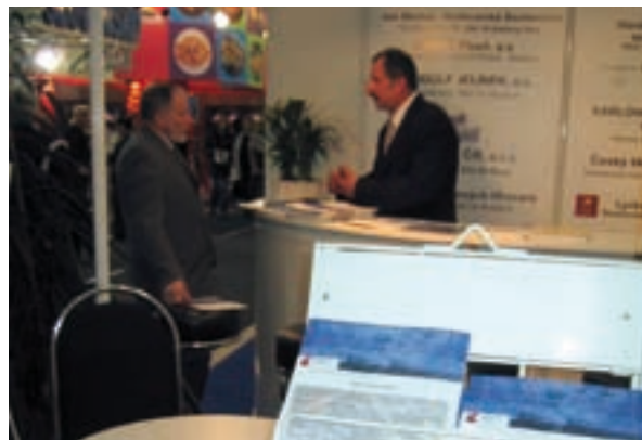
Stánek PK ČR/Oborové koordináční místo pro podnikatele, Salima 2006/Brno

Na základě uzavřené smlouvy o dodávce prací a služeb s účinností od 1. dubna 2006 přešly závazky spojené s dosavadní funkcí OKM ze strany PK ČR na Asociaci Textilního-oděvního-kožedělného průmyslu (ATOK), a pozice PK ČR se v rámci projektu změnila z „provozovatele“ na „poskytovatele“ informací a služeb.