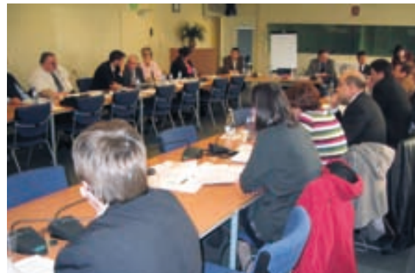
... z jednání pracovní skupiny CIAA pro výzkum/závěrečný seminář k projektu SMEs-NET, 6. duben 2006, Brusel